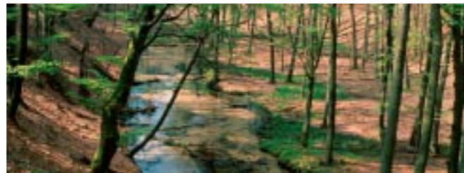
Wertvolle Teile der Natur- und Kulturlandschaft der Senne und des Teutoburger Waldes werden gesichert, entwickelt und behutsam erlebbar gemacht.

Artenreiche Kalkbuchenwälder, Reste bodensaurer Laubmischwälder, naturnahe Sand-Tieflandbäche, trockene und feuchte Heidelandschaften – das ist Grundlage für die herausragende,