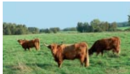
Die Sicherung des Moores durch eine extensive Bewirtschaftung der benachbarten Flächen ist ein Ziel des Projekts.

Mit 1452 Hektar Projektfläche ist das Pfrunger-Burgweiler Ried eines der bedeutendsten Moorschutzgebiete in Südwestdeutschland. Projektträger ist