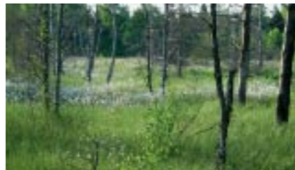
Das Wurzacher Ried ist ein Musterbeispiel dafür, wie sich ein intaktes Hochmoorgebiet auch touristisch nutzen lässt.

Das Wurzacher Ried ist eines der größten noch intakten Hochmoorgebiete Mitteleuropas. Seine verschiedenen Moorlebensräume beherbergen zahlreiche bedrohte