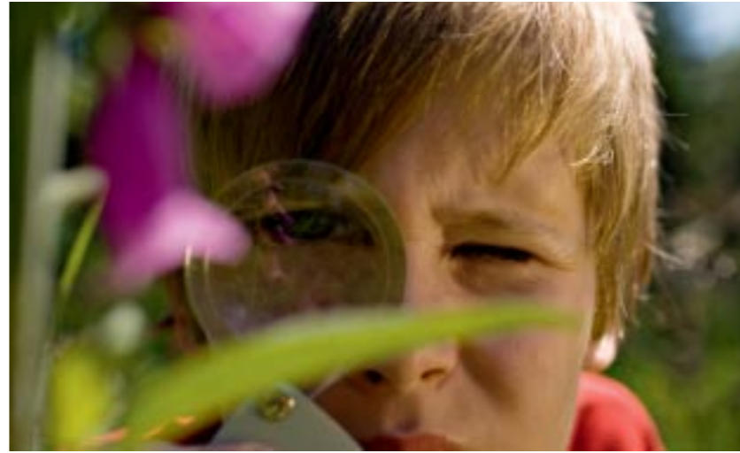
Moore sind faszinierende Natur-Erlebnisräume, zugleich aber auch sehr empfindliche Ökosysteme.