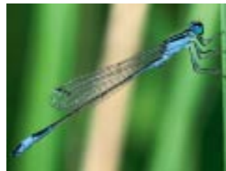
Hier kann sich die Natur unbeeinflusst vom Menschen entwickeln.

„nassen“ Bienwald sowie Teile der angrenzenden, von Grünland geprägten Niederungsbereiche. Große Gebiete der vielfältigen und reich strukturierten Waldlandschaft wurden bereits in der ersten Phase aus der Bewirtschaftung genommen und einer natürlichen Entwicklung überlassen. Nun sollen weitere Flächen folgen. Darüber hinaus sieht der Pflege- und Entwicklungsplan eine stärkere Ausrichtung der land- und forstwirtschaftlichen Nutzung an den naturschutzfachlichen Zielen vor, die Renaturierung von Bächen und auentypischen Gewässern sowie eine naturschutzkonforme Lenkung der Besucherströme. Projektträger sind die Landkreise Germersheim und Südliche Weinstraße. www.bienwald.de/?Home/Bienwald