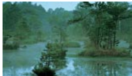
Dieses Projekt ist ein kombiniertes Wald- und Moorprojekt. Ziel ist die Stabilisierung der Moore und der Umbau der Kiefernforste.

Die Moore, Sümpfe, Bruchwälder und Nasswiesen dieses Naturschutzgroßprojekts nordöstlich von Leipzig sind ein wichtiger Lebensraum unter anderem für