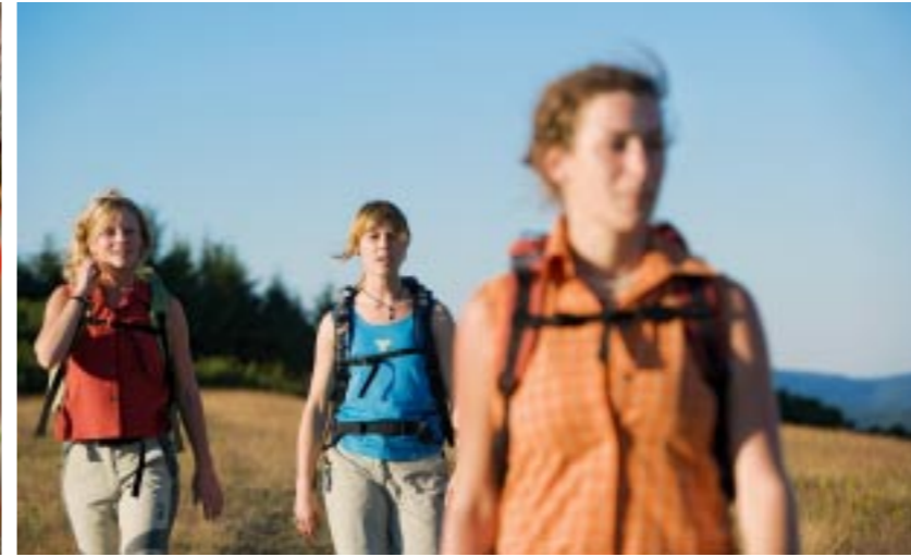
Intakte, vielfältige Natur ist attraktiv. Sowohl für die Menschen, die in der Region leben, als auch für Gäste.