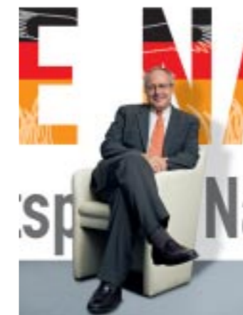
Tilo Braune, Präsident des Deutschen Tourismusverbandes e. V.

Naturschützer, Gemeinden, Landkreise, Stiftungen, Landwirte, Forstwirte, Touristiker, Landfrauen – Integrativer Naturschutz als Chance für die ländliche und regionale Entwicklung hat viele Verbündete. Gesucht werden innovative Ideen und neue Ansätze. Langfristig denken steht im Vordergrund – und – gemeinsam handeln. Sechs Interessenvertreter aus Naturschutz, Forstwirtschaft, Tourismus und Kommunalpolitik erläutern, warum sie diesen Wettbewerb unterstützen.