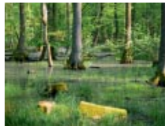
Im Bienwald entsteht eine 1 680 Hektar große Naturwaldfläche.

Der südpfälzische Bienwald zählt zu den besterhaltenen Schwemmfächerlandschaften Mitteleuropas. Das Kerngebiet des Naturschutzgroßprojekts umfasst den sogenannten