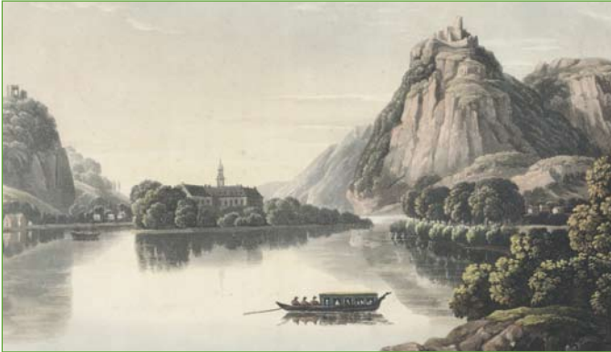
Vorreiter Siebengebirge: Als erste staatliche Naturschutz-Maßnahme gilt der Schutz des Drachenfels bei Königswinter.

Doch allmählich wandelt sich der Mensch vom machtlosen Untertan zum vermeintlichen Herrscher über die Erde – bis er die Natur am Ende bedroht. Schon in Antike und Mittelalter versuchen einige Machthaber, den Raubbau an ihr zu bremsen – wenn auch oft nur, wenn es dem Menschen nützt. So wird 1335 in Zürich der Fang von Vögeln verboten, damit diese Käfer und andere „Schadinsekten“ vertilgen können. Holz- oder Waldfrevel wird vielerorts bestraft – freilich auch, um die Jagdreviere des Adels zu erhalten.