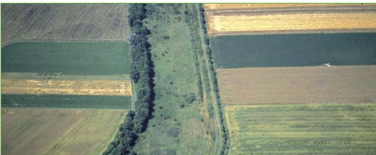
Vom Todesstreifen zur Lebensader: Das Grüne Band an der früheren innerdeutschen Grenze verbindet viele Biotope.

Noch bleibt viel zu tun. Im Vertrag der Großen Koalition von 2005 stehen mehrere vereinbarte Staatsaufgaben: So sollen für ganz Deutschland repräsentative Naturschutzflächen in einer Größenordnung von 800 bis 1250 Quadratkilometern unentgeltlich in eine Bundesstiftung eingebracht oder an die Länder übertragen werden. Der Verbrauch unversiegelter Böden ist bis 2020 von derzeit 93 auf dann 30 Hektar zu drosseln. Flüsse samt ihrer Auen-Reste will die Regierung als „Lebensadern der Landschaft“ erhalten oder wieder dazu umwandeln – auch weil das nächste Hochwasser nicht mehr fern ist, das sie (statt der Städte) schadlos überfluten könnte.