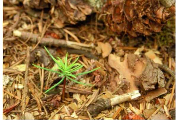
Abbildung 3: Douglasienkeimling

Bürger-Arndt (2000) schließt aus der Auswertung verschiedener Arbeiten, dass die Entwicklung der Bodenvegetation unter Douglasie maßgeblich vom Unterschied des Lichtangebotes gegenüber dem jeweiligen natürlichen Vergleichsbestand abhängt und sich daher mit forstlichen Eingriffen steuern lässt.