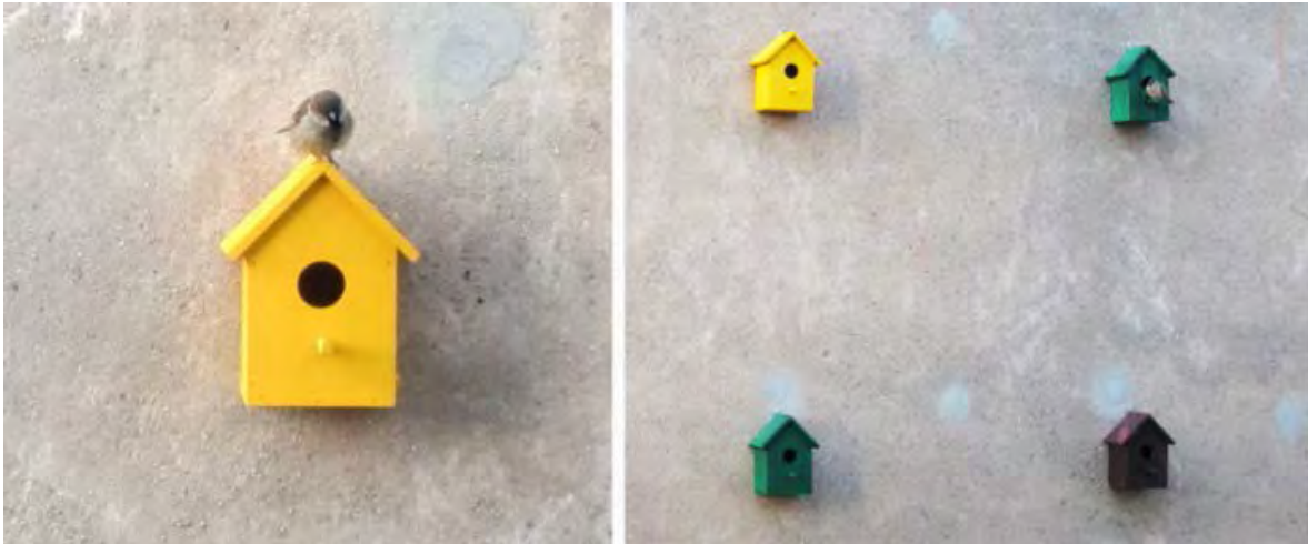
Abbildung 5: Gestaltung einer Hausfassade in Barcelona mit farbigen Nistkästen für Haussperlinge durch das Architekturbüro DOM Arquitectura

Bildquellen: DOM Arquitectura , letzter Aufruf am 26.01.2016.