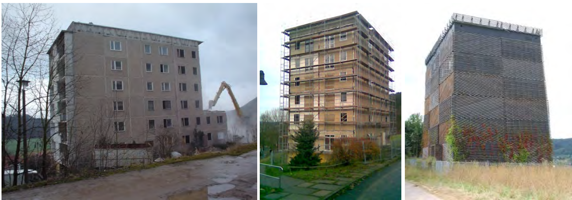
Abbildung 6: Umbau eines nicht mehr genutzten Plattenbaus zum Fledermausturm Meiningen

Um Neu- oder Ersatznistplätze nicht nur an neuen Wohn- oder Arbeitsgebäuden unterbringen zu müssen, können eigenständige Architekturelemente geschaffen werden. Dies kann in Form von Nistbäumen oder nicht mehr genutzter Gebäude erfolgen, etwa indem aufgegebene Gebäude oder Transformatorstationen umfunktioniert oder neue Gebäude gebaut werden, die ausschließlich Wohnplätze für Vögel und Fledermäuse anbieten (vgl. Abbildung 6) 52 .