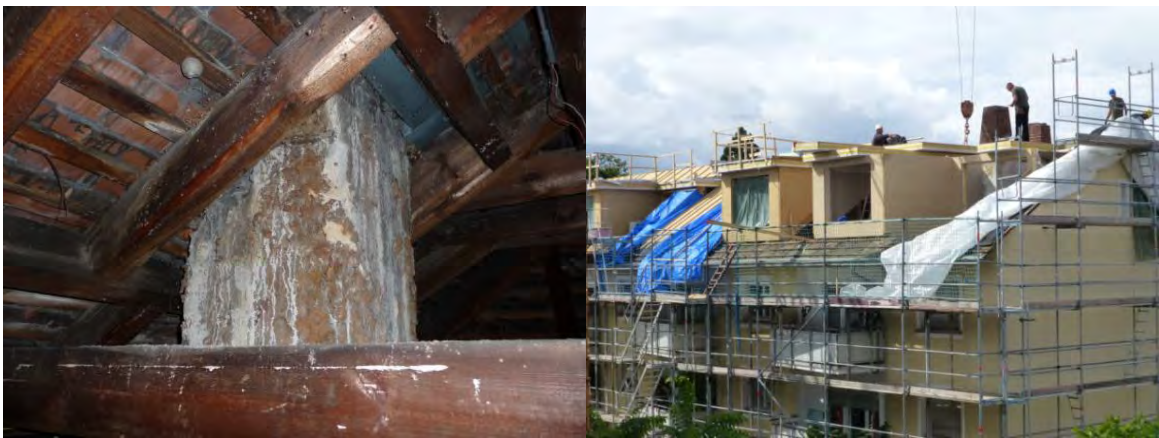
Abbildung 3: Ein vorher nicht ausgebauter Dachstuhl (links), der nach Dachausbau (rechts) und energetischer Dämmung zukünftig als Wohnraum genutzt wird.

Grundsätzlich bleibt aber festzuhalten, dass durch die vollständige Erneuerung der Außenfassade bei energetischen Sanierungen, die Chance besteht, neue Nist- und Bruthilfen ohne großen Kostenaufwand einzuplanen und herzurichten.