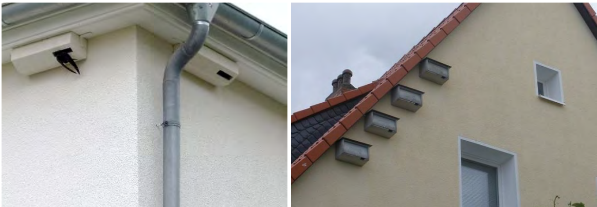
Abbildung 4: Integrationsmöglichkeiten für Mauerseglerquartiere an der Giebelwand

Daneben existieren aber auch Lösungen, die vorgehängt werden und gut sichtbar sind. Diese können gestalterisch auf die Fassadengestaltung abgestimmt werden. Dabei ist auf eine ordnungsgemäße Installation zu achten. So suchen Mauersegler bspw. immer nach Quartieren, die dicht an der Hauskante unter einem leichten Vorsprung angebracht sind. Ein Einflugloch unten am Kasten bietet ihnen den gesuchten Überstand. Darüber hinaus sind bei der Installation der Nistkästen die Eigenarten des Nistverhaltens der Tiere zu achten (vgl. Abbildung 4).