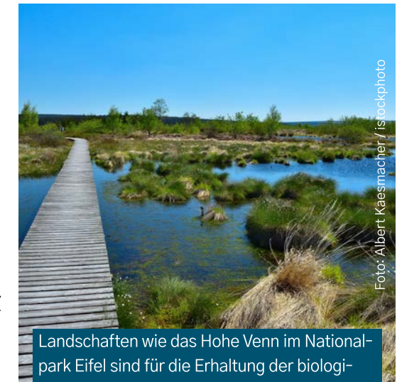
Landschaften wie das Hohe Venn im Nationalpark Eifel sind für die Erhaltung der biologischen Vielfalt von großer Bedeutung.

Neben Faktoren wie Nährstoff- und Schadstoffbelastungen, unter anderem durch eine intensive land- und forstwirtschaftliche Nutzung, sowie die Vernichtung und Überformung von Lebensräumen spielt auch die Zerschneidung von diesen Lebensräumen, zum Beispiel durch Straßen und Schienen-