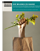
TRAFFIC-Bericht “Die Wildnis zu Hause“