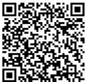
Website des BfN