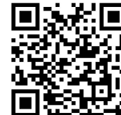
Website von TRAFFIC