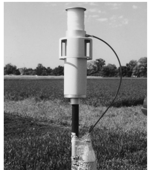
Bild 1. Technische Pollensammler: Sigma-2 mit aufmontiertem Pollenmassenfilter (PMF).

Zur Auswertung der Depositionsproben aus dem Sigma-2-Sammler steht beim DWD in Freiburg ein vollautomatisches Bildanalysesystem zur Verfügung. Zur Bestimmung der Pollenzahl und Nachweis der Artzugehörigkeit wird eine Klassifikationssoftware eingesetzt, die von der Universität Freiburg und dem DWD entwickelt wurde [14]. Der